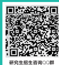
研究生招生咨询QQ群

咨询电话: 咨询邮箱: pgenquiries@xjtlu.edu.cn 申请邮箱: pgadmissions@xjtlu.edu.cn 咨询 QQ 群: 地址: 邮编: