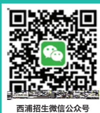
西浦招生微信公众号